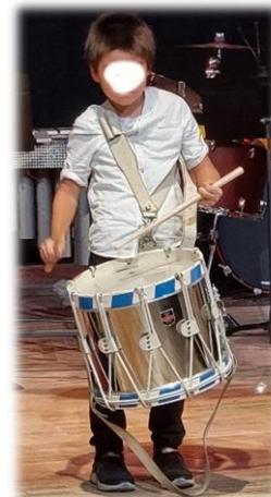
Un junior vraiment junior !