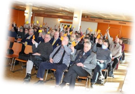
AD 2022 - Etoy